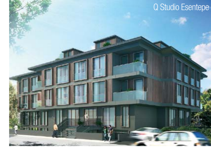
Q Studio Esentepe