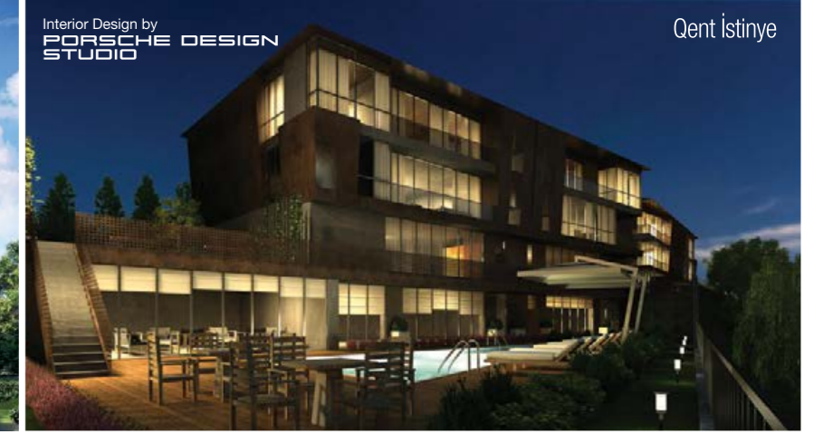
Interior Design by PORSCHE DESIGN STUDIO