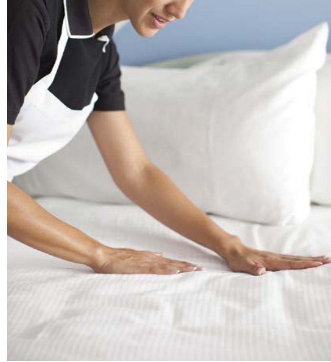
Temizlik ve house keeping